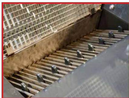
Système d'émottage (option)